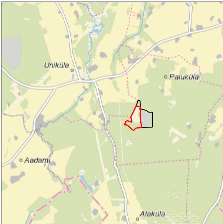
Kaardileht nr 5441 Tartu